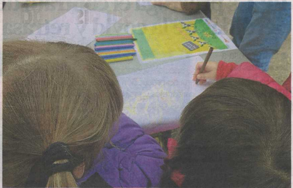
Jornada lúdica por los Derechos de la Infancia en la calle de Moret de Zaragoza, hace dos años.

Este año, debido a la covid-19, la infancia y la juventud han sido las más olvidadas, y muchos de sus derechos se han visto tambaleados: dificultad para seguir las clases de manera 'online', carencia de referentes positivos, cambio de actividades deportivas por un ocio más pasivo y consumista, problemas para interactuar o relacionarse con otros compañeros y compañeras, entre otros. Todo esto ha tenido graves repercusiones en un derecho fundamental, como es el de la salud. El derecho a la salud es un compendio entre