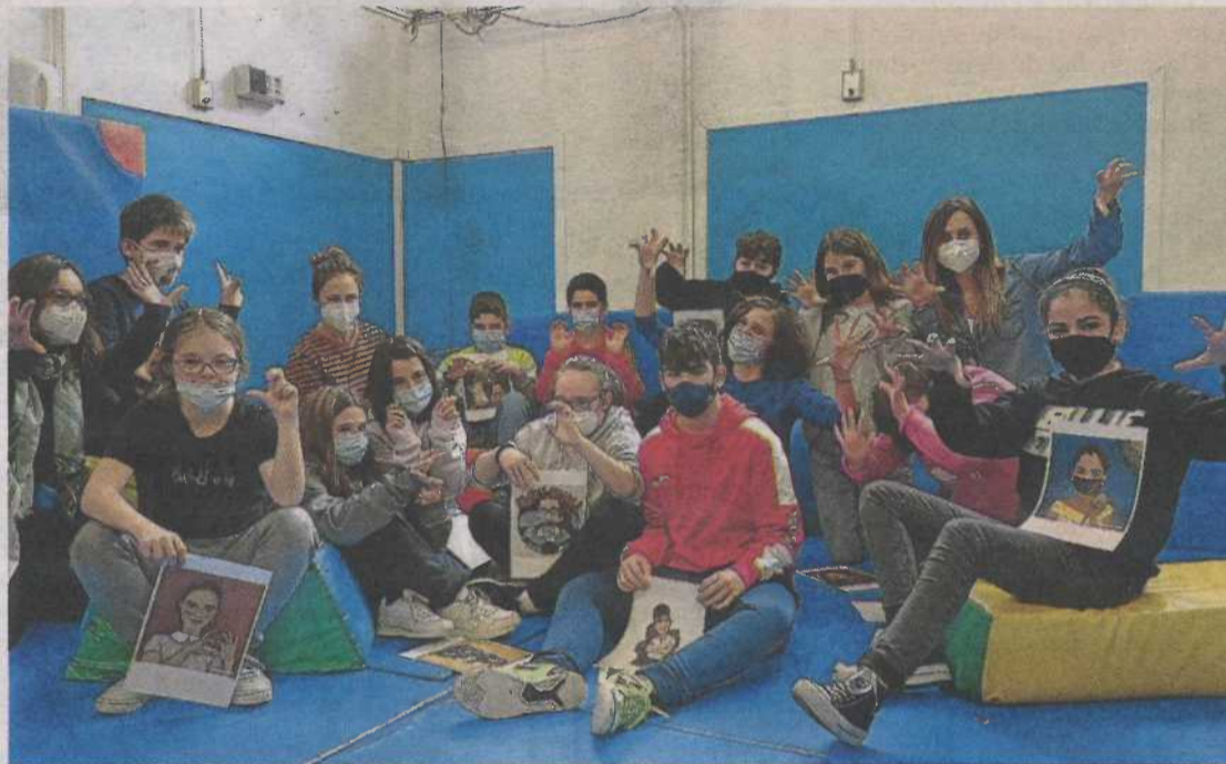
Este jueves, los alumnos del Alborada y del Puerta Sancho tuvieron su primera sesión conjunta de ensayos antes del rodaje del corto. PIA

Con la motivación de facilitar a la ciudadanía la inclusión y la accesibilidad en la programación cultural de la capital aragonesa, Plena inclusión Aragón ha involucrado al alumnado con y sin discapacidad intelectual de